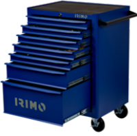
Carro con 7 cajones de 26" 9066K7